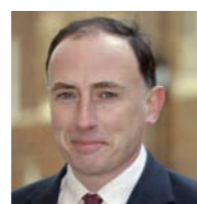
Jamie Lowther Pinkerton Oberster Sicherheits Offizier der englischen Königsfamilie