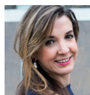
HRH Princess Tessy of Luxembourg and Nassau